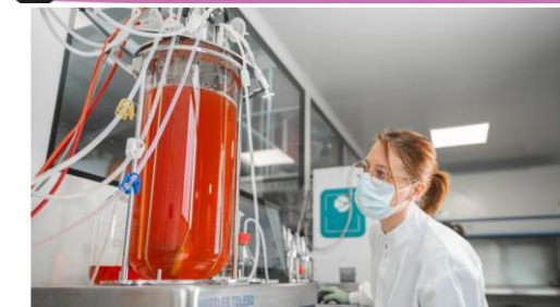
April 12, 2021

World first: TreeFrog Therapeutics announces the production of a single batch of 15 billion iPSC cells in a 10L bioreactor with exponential amplification of 276-fold per week.