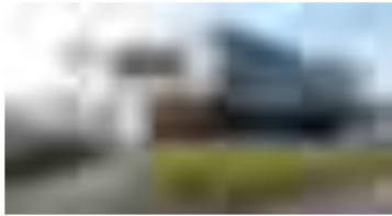
Le CHU de Poitiers

Un partenariat "exceptionnel" selon l'Agence régionale de santé. Les CHU de Poitiers, Limoges et Bordeaux ont signé ce vendredi une convention pour créer un groupement de coopération sanitaire. Objectif : mutualiser les forces pour plus d'efficacité dans la recherche ou encore l'offre de soins.